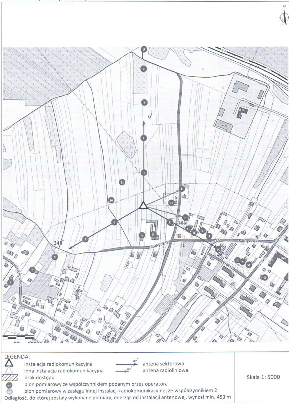
Zař. 2. Widok pionów pomiarowych

„Bez pisemnej zgody Laboratorium niniejsze sprawozdanie nie może być powielane inaczej, jak tylko w całości. Ponadto wyniki dotyczą tylko badanych obiektów przywołanych w niniejszym sprawozdaniu z badań” 78/09/OŚ/2021-P4-W